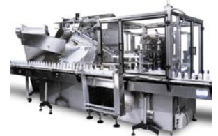
Posicionador / Seleccionador de Bombas

La línea de maquinaria especial de NEM, satisface necesidades específicas de nuestros clientes. Nuestra experiencia incluye posicionadoras - alimentadoras que manejan desde pepinos, componentes de jeringas, hasta jugos en cartón y más. Orientadoras para envases extragrandes, rectangulares y más.