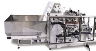
NEHHBT Posicionadora de Alta Velocidad y Larga Duración