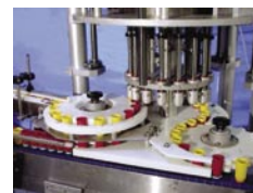
NERPA Aplicador Rotativo de Tapón