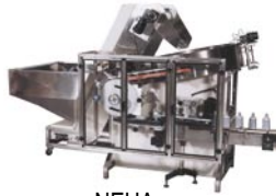
NEHA Posicionadora Horizontal Ajustable

Nuestras posicionadoras -alimentadoras permiten a los clientes llenar elevadores tipo tolva con envases de granel, para ser clasificados y alimentados hacia un transportador. Las opciones varían según el modelo, pero incluyen limpiador por aire ionizado, descargas derecha, izquierda o inclinadas y opciones eléctricas como NEMA-4 o NEMA-7.