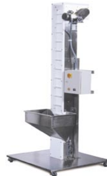
Seleccionador / Elevador de Tapa