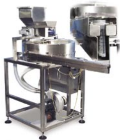
Seleccionador de Jeringa