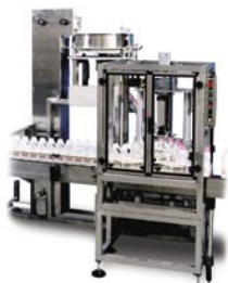
NESSTC Tapónadora de una estación con dos elementos