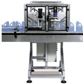
SO-6 Orientadora Rotativa En Línea