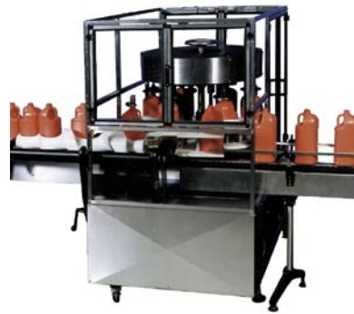
NERO Orientadora Rotativa

NEM tiene una orientadora que cubra sus necesidades específicas. Nuestra línea de orientadoras ofrece dos sistemas; líneal y rotativo. Las sistemas rotativos están disponibles con mecanismos de detección, como; sensores foto-eléctricos, sensores de proximidad, lectores de código de barras o sistemas de visión.