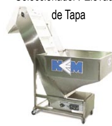
Tolva con Elevador