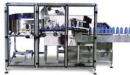
NOL Posicionadora Lineal