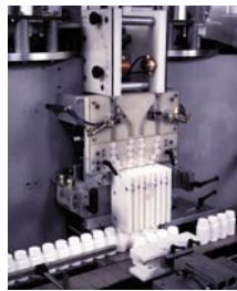
Alimentador de Disecante