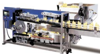
NEHHL Posicionadora Horizontal de Bajo Perfil