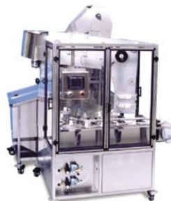
NERBU Posicionadora Rotativa Sin Bandas