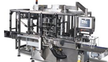
NERCC Tapónadora Rotativa de Mandril