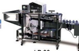
LP-36 Posicionadora de Bajo Perfil