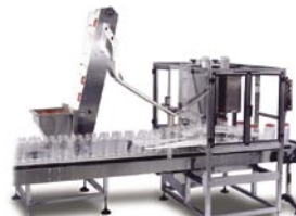
NEDHC Tapónadora de 2 cabezas