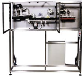
Volteador de Contenedores