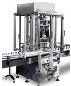
Insertador / Desmontador de Envases

La línea de maquinaria especial de NEM, satisface necesidades específicas de nuestros clientes. Nuestra experiencia incluye posicionadoras - alimentadoras que manejan desde pepinos, componentes de jeringas, hasta jugos en cartón y más. Orientadoras para envases extragrandes, rectangulares y más.