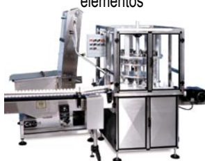
NERCA Aplicador Rotativo de Tapas

Las retorqueadoras de NEM, aprietan tapas flojas. Son ideales para usarse después del sellado de inducción para asegurar que las tapas estén colocadas correctamente.