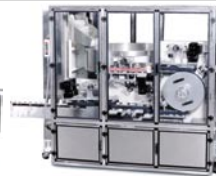
NEHCP Posicionadora Compacta