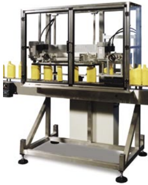
SO-3 Orientadora En Línea