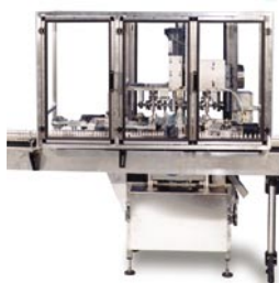
Probador de Aerosoles