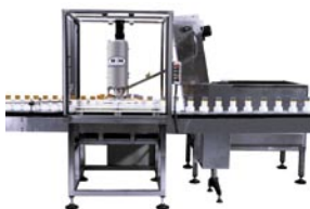
NESHC Tapónadora de una cabeza

Nuestras taponadoras pueden manejar una amplia variedad de tapas, tapones, tapas plásticas a presión y envases, así como un amplio rango de velocidades. Cada modelo ofrece una lista de opciones, que incluyen: lectura digital de par, control de proceso estadístico, alimentadores de tapas "inusuales" y diferentes opciones eléctricas.