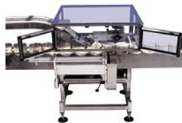
NESOL Tapónadora de Fricción