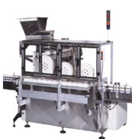
Alimentador de Cucharones y Cucharitas