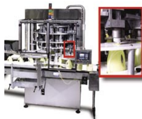
Insertador Rotativo de Boquillas

Para más información sobre estos productos entre en contacto con NEM en (941)755-5550 o con nuestros representantes locales.