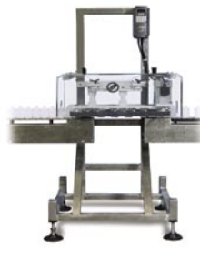
Sistema de Transferencia sin fondo