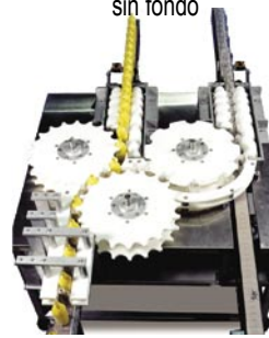
Combinador de carriles